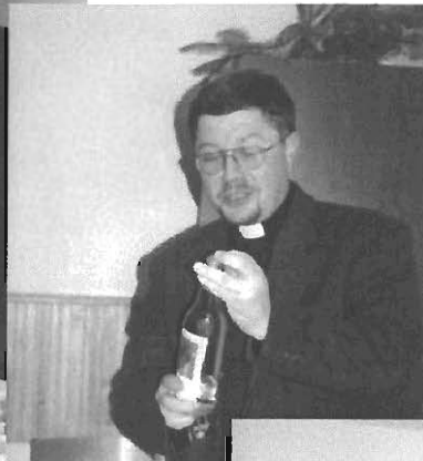
... winem z Kanny Galilejskiej, lecz jak tą butelkę się otwiera? – niestety nie mam wprawy...”