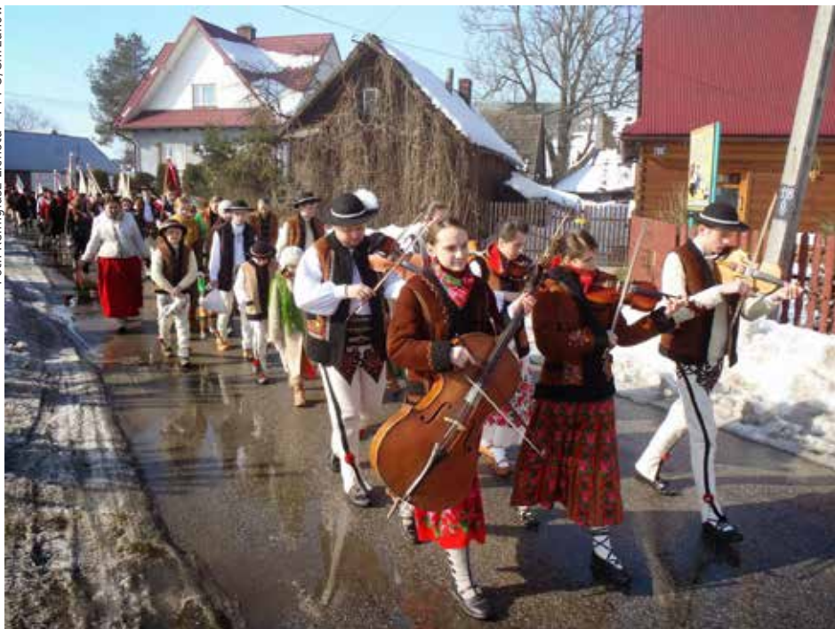
▲ Uroczysty przemarsz na cmentarz