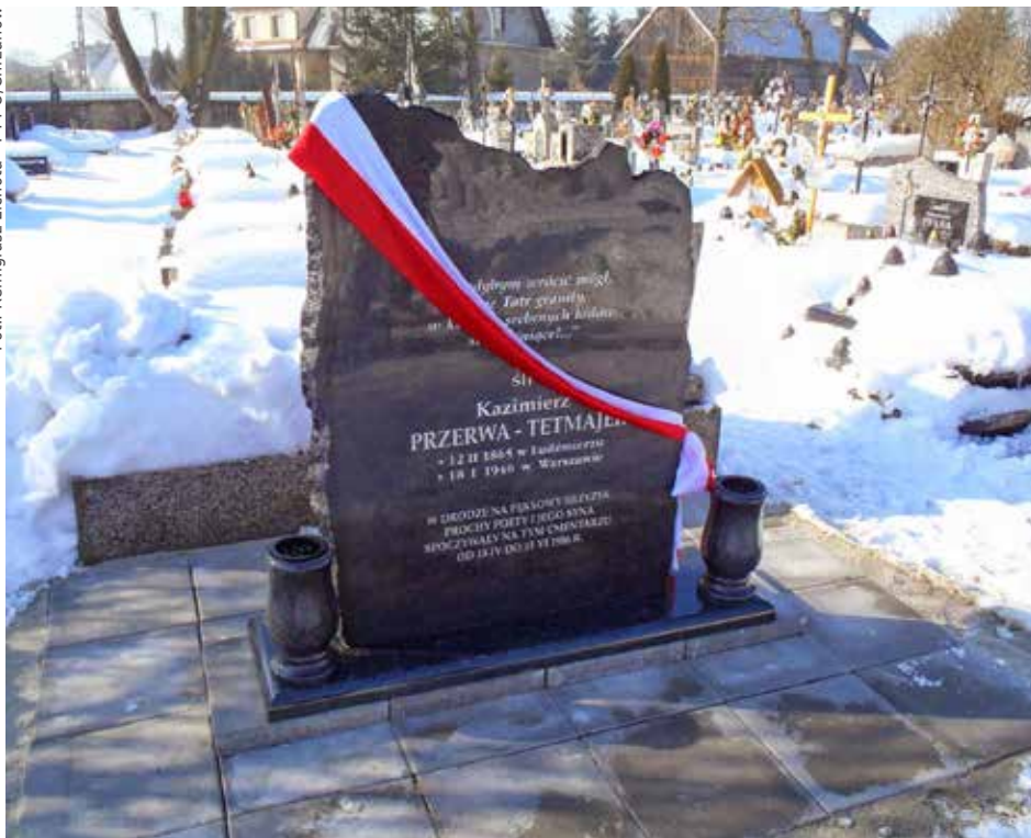
▼ Tablica poświęcona Kazimierzowi Przerwie-Tetmajerowi