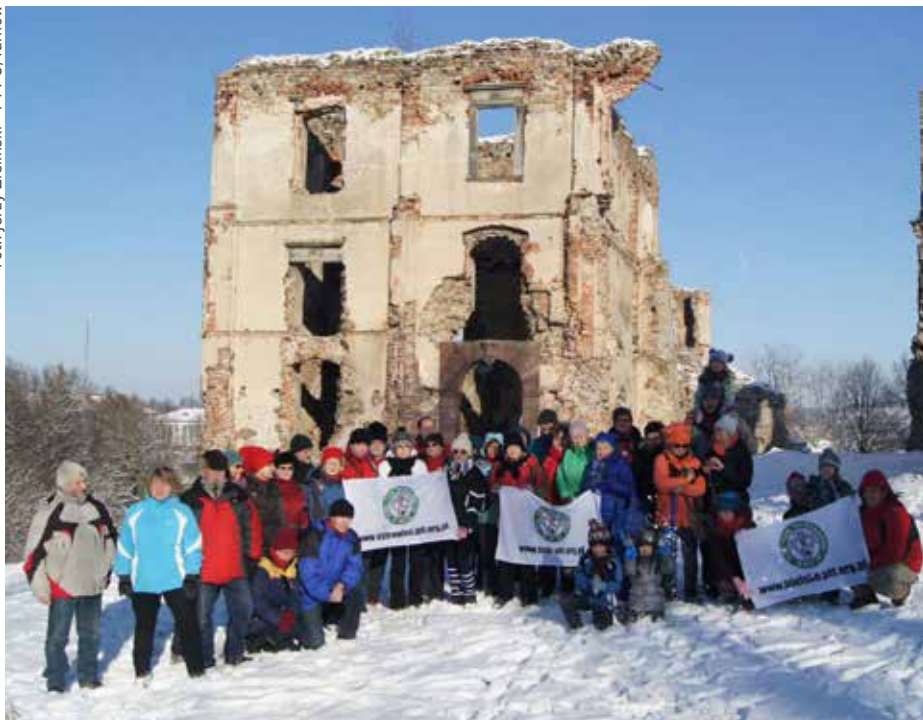
Uczestnicy spotkania przy ruinach zamku w Bodzentynie

cze, lecz także początkujący piechurzy. Mali adeptci wędrowania, którzy przyjechali z rodzicami, spisali się znakomicie. Droga wiodła od Św. Katarzyny przez Łysicę do Bodzentyna.