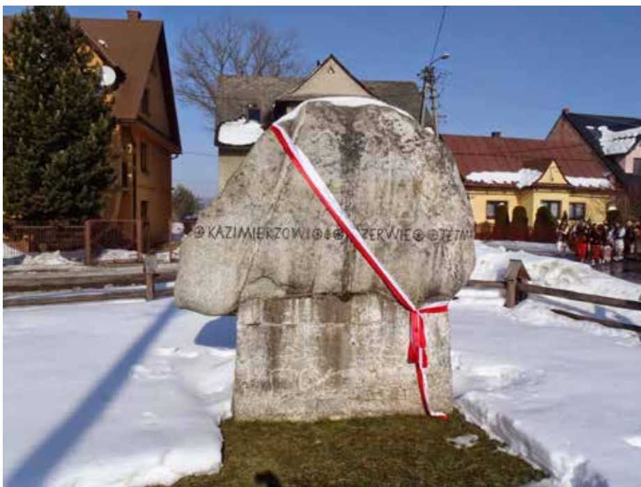
Głaz poświęcony Kazimierzowi Przerwie-Tetmajerowi ustawiony z okazji 100. rocznicy urodzin w 1965 r.

tablica z czarnego marmuru, u f u n d o w a n a przez władze gminy Nowy Targ, która została uroczystie odsłonięta. Wśród osób zaproszonych do jej odsłonięcia był także prezes PTT, Józef Haduch. Tablica będzie przypominać dwumiesięczny pobyt na tym cmentarzu prochów Kazimierza Przerwy-Tetmajera i jego syna Stanisława Kazimierza (13.04. - 15.06.1986)