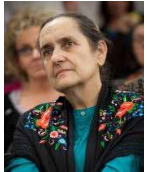
Zmarła 25 stycznia 2015 r. w Krakowie. Została pochowana u stóp Babiej Góry w Zawoi. ■

Była odznaczona Złotym Krzyżem Zasługi za całokształt działalności, Zasłużony Działacz Kultury. Była laureatką nagrody im. Oskara Kolberga za zasługi dla kultury ludowej, nagrody im. Romana Reinfussa za działalność na rzecz zachowania lokalnej tożsamości kulturowej w Małopolsce.