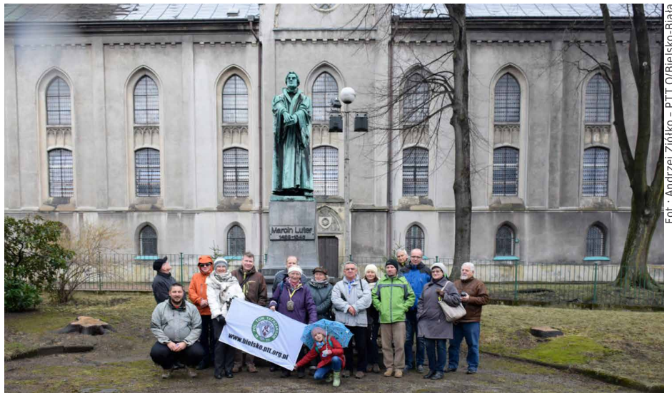
Przed pomnikiem Marcina Lutra