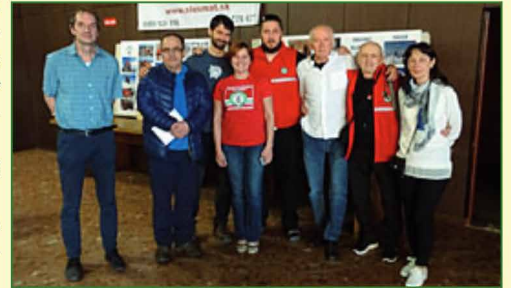
Informacja o spotkaniu PTT i SVTS z miesięcznika „Sprawodaj SVTS” z marca 2017 r.

Na záver stretnutia nás pozvali na ich jesenné stretnutie, ktoré sa uskutoční v októbri 2017 v Zakopanom.