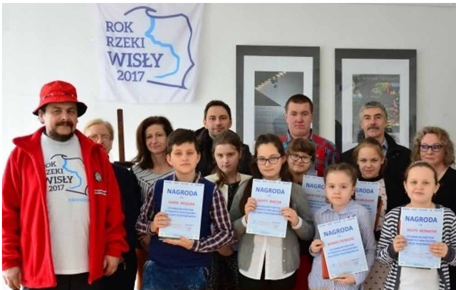
▲ Uczestnicy VIII Dęblińskiego Dnia Wróbla i laureaci VI Konkursu Poetyckiego