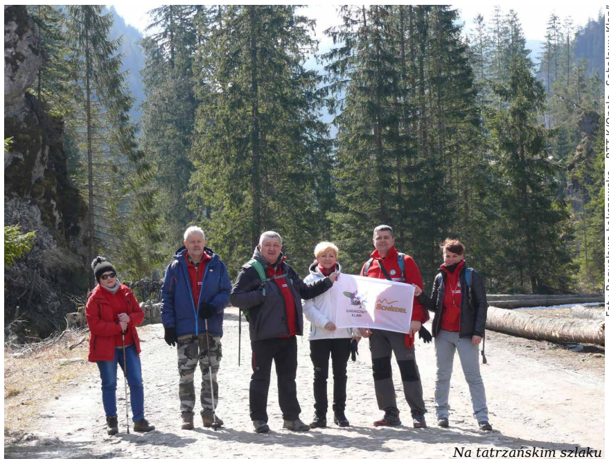
Na tatrzańskim szlaku

Jeszcze tego samego dnia późnym wieczorem wracaliśmy do Opola. ■