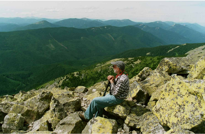
▲ W Karpatach Wschodnich, 2006 r.