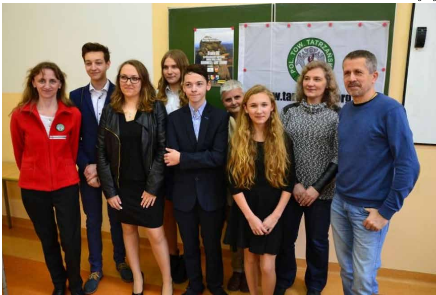
Pamiątkowe zdjęcie zwycięzców z SK PTT nr 1 w Tarnowie wraz z jury

W uznaniu trudu włożonego w przygotowanie do konkursu i uzyskanych bardzo dobrych wyników, jury postanowiło nagrodzić dziewięć osób z najlepszymi rezultatami oraz trzy najlepsze drużyny. Wyróżnieni otrzymali, dyplomy, przewodniki, mapy i książki a także cenne nagrody rzeczowe związane z turystyką górską. Zostały one ufundowane przez Urząd Marszałkowski Województwa Małopolskiego, Starostwo Powiatowe w Tarnowie, Karkonoski Park Narodowy, Park Narodowy Gór Stołowych, wydawnictwa Bezdroża i Compass oraz Urzędy Miast w Kudowie-Zdrój, Szklarskiej Porębie i Karpaczu. Redakcja Magazynu Turystyki Górskiej „npm” ufundowała dla zwycięzcy półroczną prenumeratę czasopisma. Wszyscy uczestnicy otrzymali drobne upominki oraz materiały reklamowo-edukacyjne przesłane przez darczyńców. Tematem przyszłorocznej edycji konkursu będą Pieniny. ■